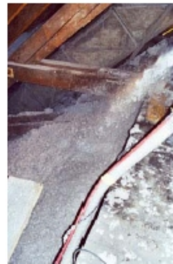
Zvlhčený nástrek na klenbu

Rovnomerné rozloženie CLIMATIZERu PLUS možno zaistiť výškovými značkami. Na silne oblúkových plochách musí byť izolácia zaistená pred zosunutím možno použiť ľahko zvlhčený nástrek (riadiť sa smernicami pre spracovanie CLIMATIZERu PLUS).