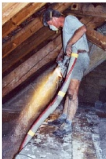
Zvlhčený nástrek na klenbu